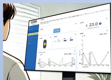
遠隔管理・操作システム (共和電機作成)