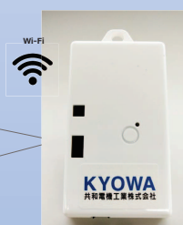
IoT Gateway (共和電機製)